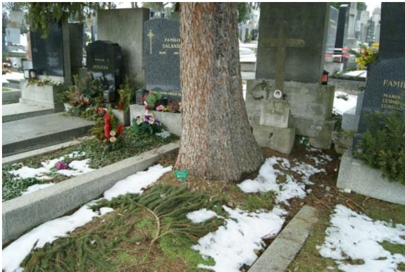
Abbildung 1: Baumwuchs verhindert Beisetzungen auch bei angrenzenden Grabstellen

Weiters bestanden Bäume, deren Wurzeln sich über mehrere Grabstellen ausbreiteten. Somit waren auch in angrenzenden Grabstellen Beisetzungen z.T. nicht möglich, da beim Ausheben eines mit Wurzeln durchwachsenen Grabes eine Beeinträchtigung der Standsicherheit des betroffenen Baumes resultieren kann (s. Abb. 1).