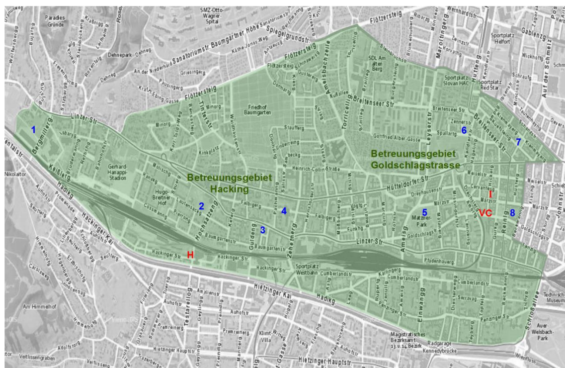
Abbildung 1: Betreuungsgebiet Verein Kiddy & Co, Verein für kreatives Spiel und Kommunikation