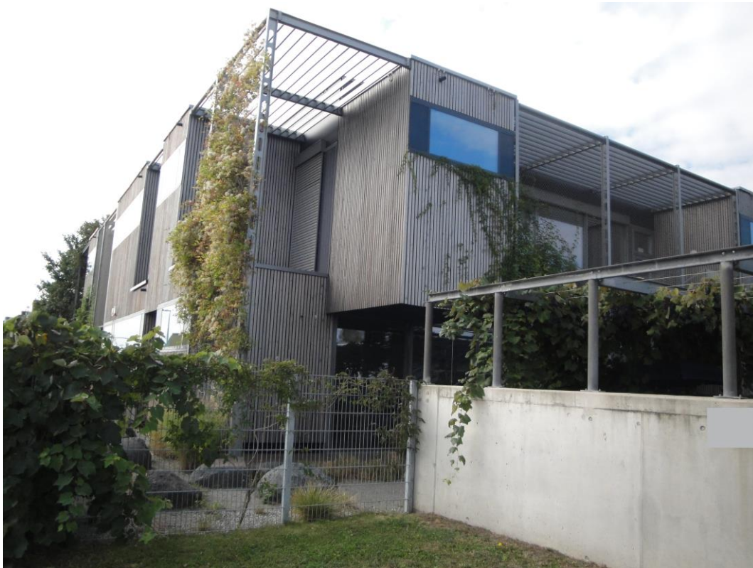
Abbildung 2: Ansicht Kindergarten