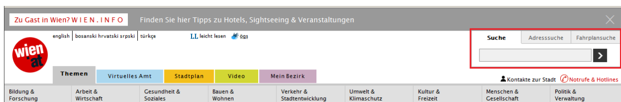
Abbildung 2: Einbindung der Suchfunktion in wien.at (rote rechteckige Markierung)